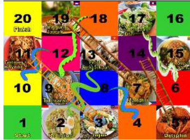
Gambar 3. Desain awal media permainan ular tangga berwarna

Berdasarkan pada gambar 2 diatas desain awal yang dibuat dengan dari media yang dibuat ini terlebih dahulu adalah dengan menggambar desain media pada kertas folio. Setelah itu alat dan bahan untuk membuat dadu meliputi kertas karton, lem, penggaris, pensil, penghapus, gunting, dan gambar negara-negara anggota ASEAN. Setelah semua bahan dan alat sudah siap langkah selanjutnya untuk membuat desain yaitu dengan menggambar dikertas folio terlebih dahulu yang terdapat 20 kolom serta didalamnya terdapat gambar ular dan tangga disertai dengan tulisan nama bendera negara anggota asean dan tulisan mengenai contoh dari nilai karakter. Selanjutnya dari desain awal yang dibuat dikertas folio akan didesain untuk menjadi desain berwarna yang nantinya akan di tunjukkan kepada dosen ahli media. Desain tersebut dapat dilihat pada gambar 3.