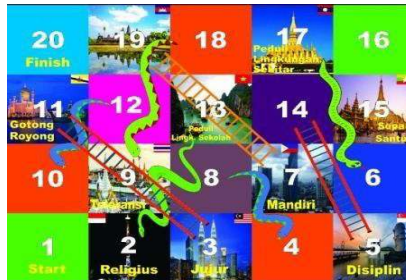
Gambar 4. Desain media sudah direvisi

Berdasarkan gambar 3 desain media yang dibuat dengan berbagai warna dan baground makanan khas dari negara anggota asean. Pada desain 3 ini peneliti menunjukkan desain kepada dosen ahli media namun masih membutuhkan perbaikan atau revisi dari desain media tersebut. Dosen ahli media menyarakankan bahwa baground harus diganti. Selanjutnya peneliti akan merevisi lagi dan akan menunjukkan hasil desainnya kepada dosen ahli media. Desain yang sudah direvisi oleh peneliti dapat dilihat pada gambar 4.