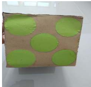
Gambar 6. Dadu sebelum divalidasi oleh dosen ahli media

Berdasarkan pada gambar 5 desain akhir dari media pembelajaran permainan ular tangga yang sudah direvisi oleh peneliti dan sudah di ACC oleh dosen ahli media dan ahli materi selanjutnya akan dicetak dalam media nyata yang berupa banner. Selanjutnya peneliti juga membuat sebuah dadu dari kardus. Dadu tersebut dapat dilihat pada gambar 6.