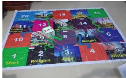
Gambar 8. Media dan dadu sudah siap digunakan

Pada gambar 7 tersebut dadu sudah dinyatakan bisa digunakan dengan melakukan uji coba terlebih dahulu. Dadu tersebut dengan kardus dibentuk persegi dan dilapisi dengan stiker warna putih dan gambar negara anggota asean serta angka dadu. Selanjutnya hasil akhir dari desain media dan dadu di cetak dalam bentuk nyata dapat dilihat pada gambar 8.