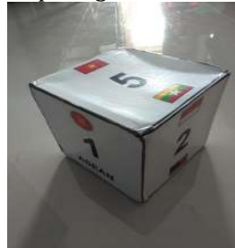
Gambar 7. Dadu sudah divalidasi oleh dosen ahli media

Pada gambar 6 menunjukkan bahwa dadu tersebut ternyata sudah banyak yang menggunakan, sehingga dosen ahli media menyarankan bahwa dadu tersebut harus direvisi ulang dengan mengganti angka dadu yang semula dibuat dengan lingkaran kecil-kecil, maka akan di revisi dengan mengganti angka yang dilengkapi dengan background warna putih dan terdapat sebuah nama asean serta gambar negara anggota asean. Dadu yang sudah direvisi oleh peneliti dapat dilihat pada gambar 7.