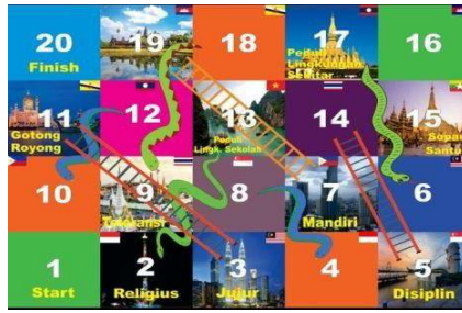
Gambar 5. Desain akhir media pembelajaran permainan ular tangga berkarakter

Berdasarkan pada gambar 5 desain akhir dari media pembelajaran permainan ular tangga yang sudah direvisi oleh peneliti dan sudah di ACC oleh dosen ahli media dan ahli materi selanjutnya akan dicetak dalam media nyata yang berupa banner. Selanjutnya peneliti juga membuat sebuah dadu dari kardus. Dadu tersebut dapat dilihat pada gambar 6.