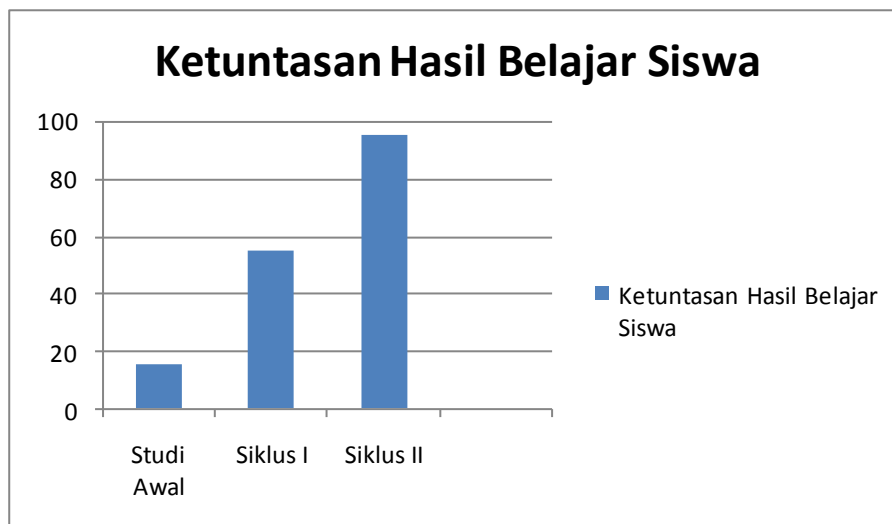
GAMBAR 2. Persentase ketuntasan belajar siswa

Pada pra siklus, diketahui bahwa hanya 3 siswa atau 15 % yang mencapai prestasi belajar tuntas/diatas KKM (mendapat nilai \geq 70 ), sedangkan 85 % tidak mencapai nilai tuntas belajar (mendapat nilai < 70 ). Pada siklus I, telah menunjukkan adanya peningkatan ketuntasan hasil belajar siswa dari 15 % menjadi 55 %, maka dapat disimpulkan bahwa meskipun telah mengalami peningkatan namun belum bisa dikatakan berhasil, karena apabila diukur dengan indikator keberhasilan, pencapaiannya belum memenuhi target, yaitu minimal 80%. Pada siklus II, telah menunjukkan adanya peningkatan ketuntasan hasil belajar siswa dari 55 % menjadi 95 %, maka dapat disimpulkan bahwa pembelajaran pada siklus 2 mengalami peningkatan dan dapat dikatakan berhasil apabila diukur dengan indikator keberhasilan, serta pencapaiannya telah memenuhi target, yaitu minimal 80%. Adapun grafik mengenai peningkatan ketuntasan belajar siswa disajikan sebagai berikut: